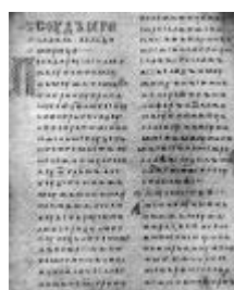
Двинская уставная грамота

Лихоимец – жадный вымогатель, взяточник».