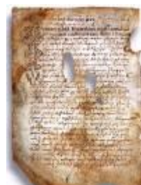
Псковская судная грамота

Двинская уставная грамота 1397 года. Мздоимство упоминается в русских летописях XIV века, например в Двинской уставной грамоте 1397 года в статье 6: «А самосуда четыре рубли, а самосуд то: кто изыснав татя с поличным, да отпустит, а себе посул возьмет, а наместники доведаются по заповеди, ино то самосуд, а опричь того самосуда нет». Там же, в статье 8: «...а черес поруку не ковати, а посула в железех не просити; а что в железех посул, то не в посул».